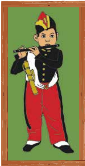
illustration by MEGUMI MORISHITA