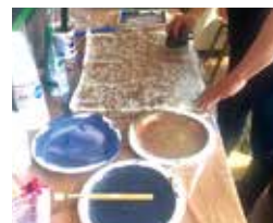
作品展に向けて制作中！

先月も触れていた通り、8月はミナトマチファクトリーの作品展がアルカスで開催されます。今回はなるべく多くのスタッフに展示会を意識してもらうため、大きな作品をみんなで制作しました。非常に迫力のある作品となっているので、ぜひ生で見たいと思っています。