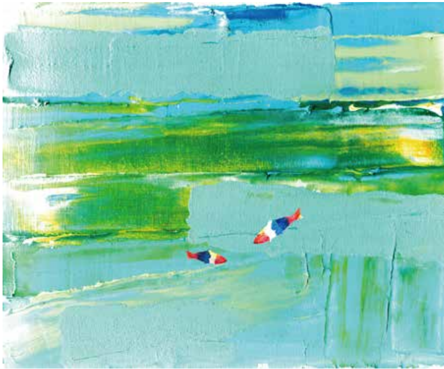
illustration by TAISUKE MAEDA

〒857-0871 佐世保市本島町 4-26 ライナービル 4F Tel:0956-23-7565 Fax:0956-59-8865 Mail:hotlife.sasebo@gmail.com