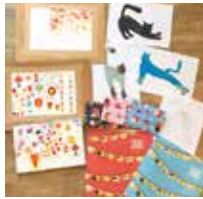
ランタンフェスティバルに 向けて新作を制作中!

長かった夏が終わったものの、気温が安定せず秋を感じられる瞬間が少ない今日この頃ですが、ミナトマチではしっかりと「芸術の秋」が機能しているようで、早くも来年のランタンフェスティバルに向けて素晴らしい作品が続々と誕生しています! あまりにも映えずぎていて自慢しなくなったので、その一部を紹介しておきますね。