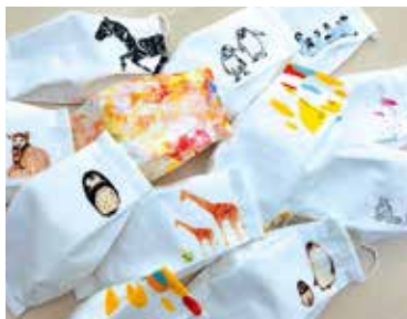
就労継続支援B型 佐世保布小物製作所