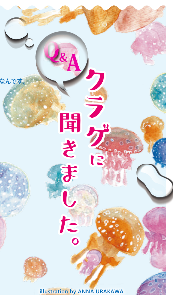
illustration by ANNA URAKAWA