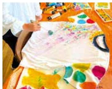
就労継続支援B型 ミナトマチファクトリー