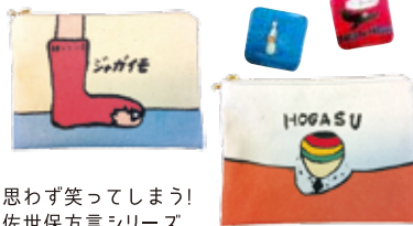
思わず笑ってしまう！ 佐世保方言シリーズ。

■お取引様例「海きらら」「TSUTAYA五番街店」「森きらら」「東急ハンス長崎駅」「長崎県美術館」etc.