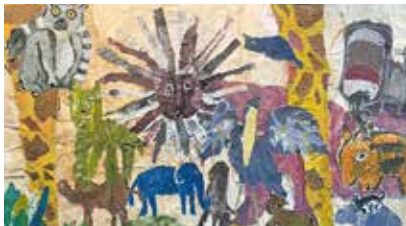
スタッフの技が集結した大迫力の共同作品

8月はアルカスの展示会の準備で忙しい月となりましたが、みんなの手際の良さで余裕を持って乗り切ることができました。そして今回も絵のタイトルを作者自身に考えてもらったのですが、前回よりもよく練られたタイトルがズラリと並び、みんなの成長が伺えてニヤニヤしてしまいました。今後もタイトルに注目して欲しいです。