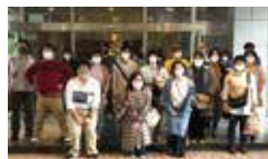
▲みなさん、いい笑顔♪ 和気あいあいとランチを堪能中!