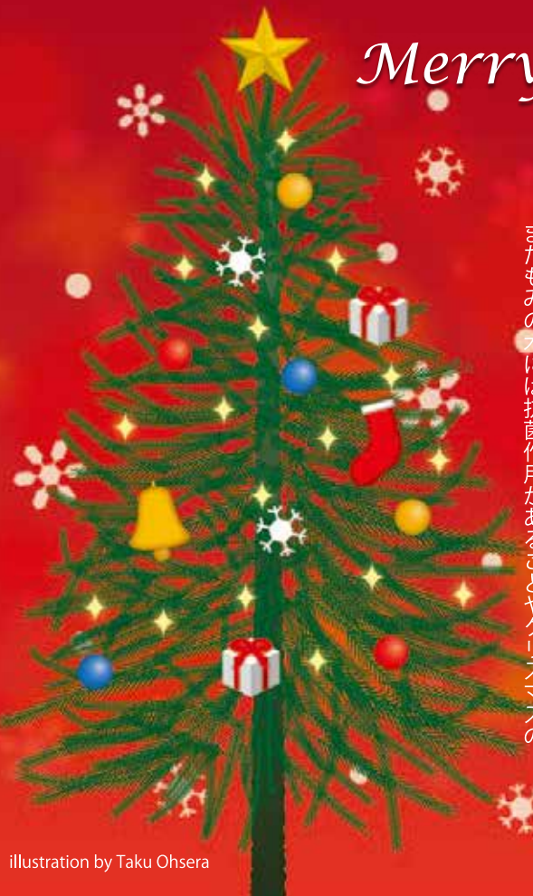
illustration by Taku Ohsera

クリスマスツリーの起源は諸説ありますが、北ヨーロッパに住んでいたゲルマン民族の冬至のお祭りから始まったのではないかとされています。クリスマスツリーで使用されるもみの木は常緑樹で冬でも青々と葉を茂らせており、その生命力は厳しい冬を過ごさなくてはならない人々にとって豊かな生命力を感じさせる存在だったのでしょう。実際に、もみの木の学名はアビエス(abies)、ラテン語で「永遠の命」を意味しています。またもみの木には抗菌作用があることやクリスマス木の