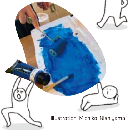
illustration: Michiko Nishiyama

Tシャツの起源は今から100年以上前の第一次世界大戦中に遡ります。当時、アメリカ海軍の制服はウール素材で分厚くて重く、夏の暑さには適さないものでした。一方でヨーロッパ兵は綿素材の軽くて薄く、乾きやすい肌着を着用していました。これを真似てアメリカ兵が作った綿の肌着がTシャツの原型といわれています。